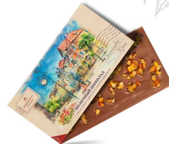
Молочный шоколад с апельсином и орехом в соленой карамели Содержание какао 35 % Вес 80 г