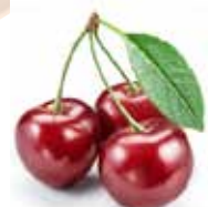
Марципан с вишней в тёмном шоколаде Содержание миндаля 38 % Вес нетто 85 г