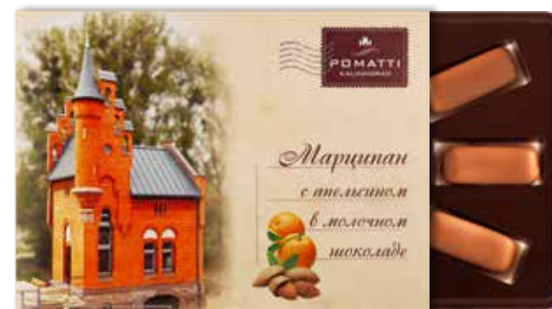
Марципан с апельсином в молочном шоколаде Содержание миндаля 44 % Вес 130 г