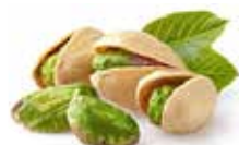
Марципан с фисташкой в тёмном шоколаде Содержание миндаля 38 % Вес нетто 85 г