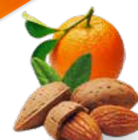
Марципан с апельсином в тёмном шоколаде с миндалём Содержание миндаля 37,5 % Вес нетто 85 г