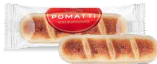
Марципановый батончик по рецептам Кёнигсберга Содержание миндаля 44 % Вес 40 г