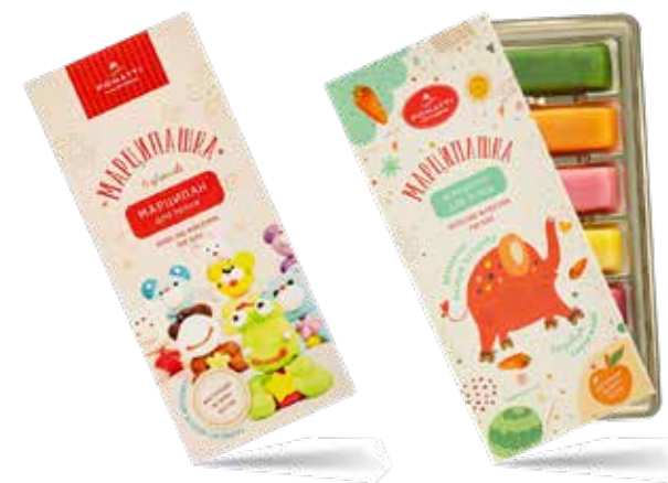
Марципан для лепки Содержание миндаля 26 % Вес 75 г

«МАРЦИПАШКА» — марципан для лепки. Очень вкусная миндально-сахарная пластичная масса, сочетающая в себе полезные свойства миндаля и янтаря, идеальный материал для всестороннего развития ребенка. Лепка из марципана развивает мелкую моторику рук (научно доказано, что она напрямую влияет на развитие речи малыша, координацию движений, память и логическое мышление), благотворно влияет на нервную систему, психическое и эмоциональное состояние малыша, ребенок концентрируется, учится терпению, усидчивости, аккуратности.