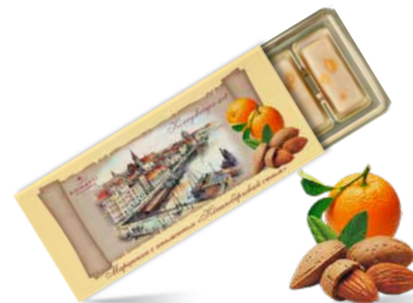
Марципан с апельсином «Кёнигсбергский стиль» Содержание миндаля 44 % Вес 85 г