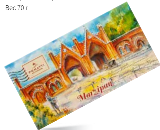
Марципан фисташковый Содержание миндаля 33 % Вес 70 г