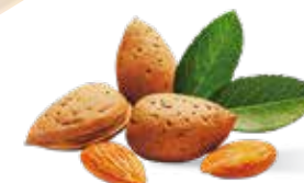
Марципан в тёмном шоколаде с миндалём Содержат абрикосовую косточку 40 % и миндаль 18 % Вес нетто 85 г