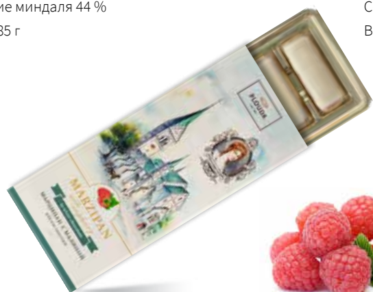
Марципан с малиной в белом шоколаде Содержат абрикосовую косточку 40 % и миндаля 18 % Вес нетто 85 г