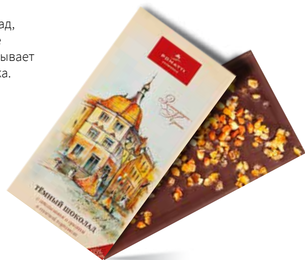
Тёмный шоколад с апельсином и орехом в соленой карамели Содержание какао 55 % Вес 80 г

Компания постоянно совершенствует технологию производства всех видов продукции, обновляет ассортимент, создает новые оттенки аромата и вкуса, позволяющие удовлетворить потребности каждого покупателя. Следует отметить, что шоколад, произведенный нашим предприятием, не содержит пальмовое масло, которое оказывает негативное влияние на организм человека.