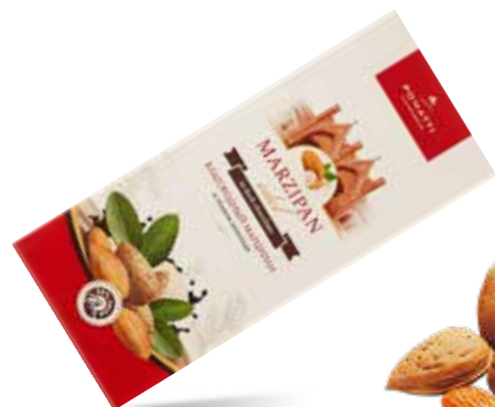
Благородный марципан в тёмном шоколаде Содержание миндаля 44 % Вес нетто 85 г