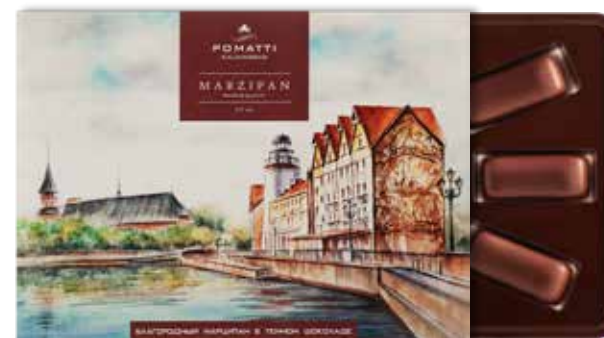
Благородный марципан в тёмном шоколаде Содержание миндаля 44 % Вес 130 г