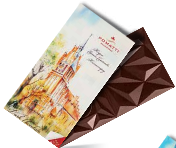
Шоколад тёмный Содержание какао 85 % Вес 80 г