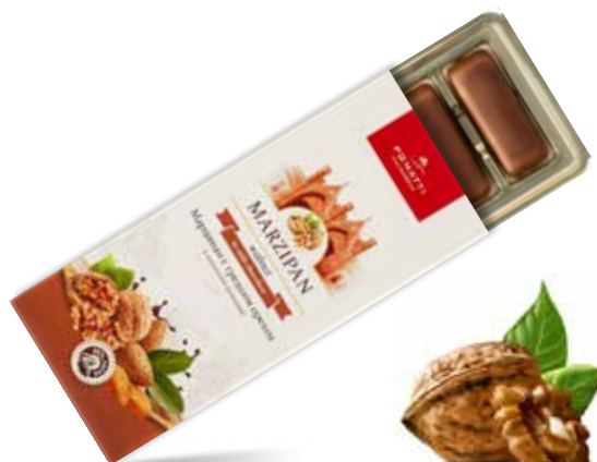
Марципан с грецким орехом Содержание миндаля 44 % Вес нетто 85 г