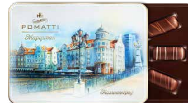
Марципан "Калининград" Содержание миндаля 44 % Вес 260 г