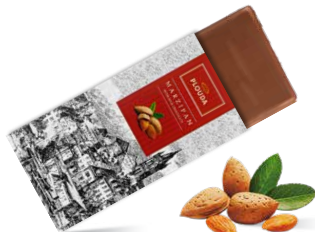
Марципан в молочном шоколаде Содержание абрикосовой косточки 40 % и миндаля 18 % Вес 70 г