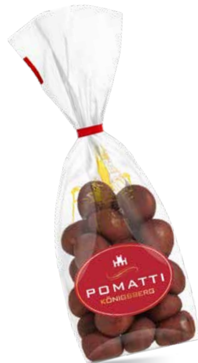
Марципановая картошка Содержание миндаля 44 % Вес 125 г