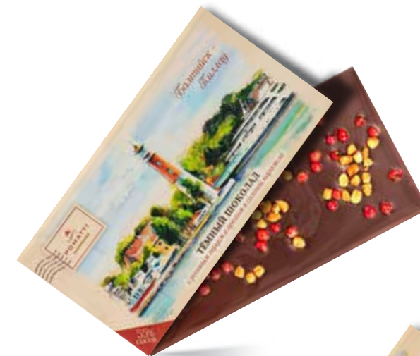
Тёмный шоколад с розовым перцем и орехом в соленой карамели Содержание какао 55 % Вес 80 г