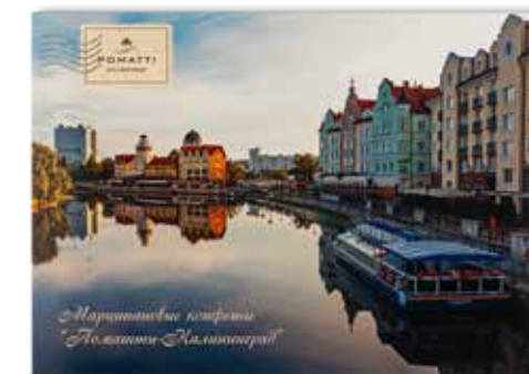
Марципановые конфеты "Поматти-Калининград" Содержание миндаля 44 % Вес 130 г