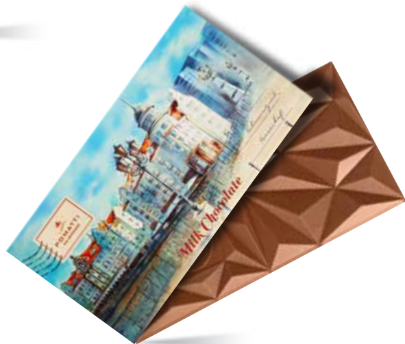
Шоколад молочный Содержание какао 35 % Вес 80 г