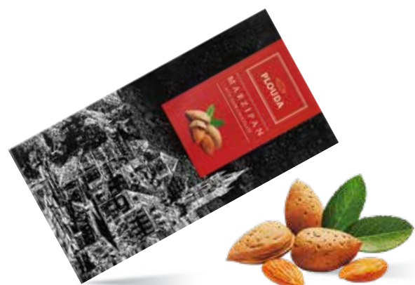
Марципан в тёмном шоколаде Содержание абрикосовой косточки 40 % и миндаля 18 % Вес 70 г