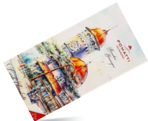
Шоколад тёмный Содержание какао 55 % Вес 80 г