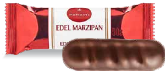
Марципановый батончик в тёмном шоколаде Содержание миндаля 44 % Вес 50 г