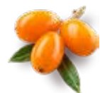
Марципан с облепихой в тёмном шоколаде Содержание миндаля 33,5 % Вес нетто 85 г