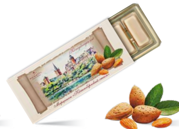
Марципан «Кёнигсбергский стиль» Содержание миндаля 44 % Вес 85 г